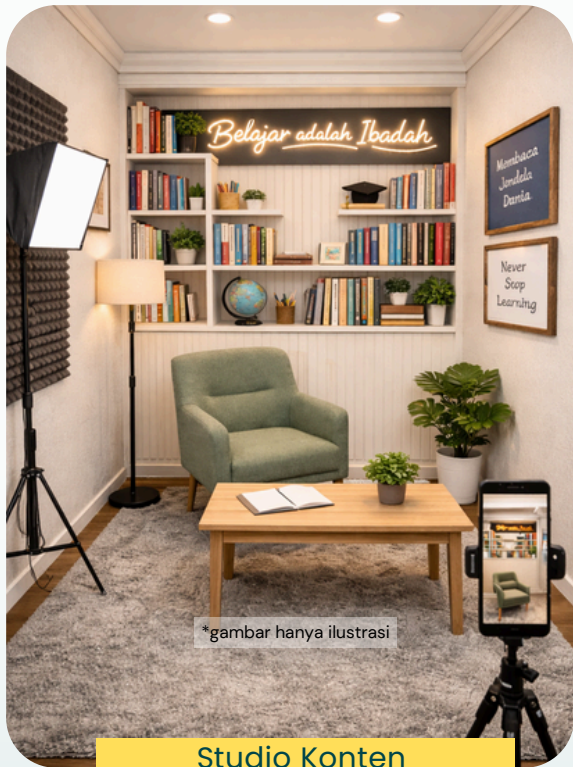
Studio Konten dan Kantor