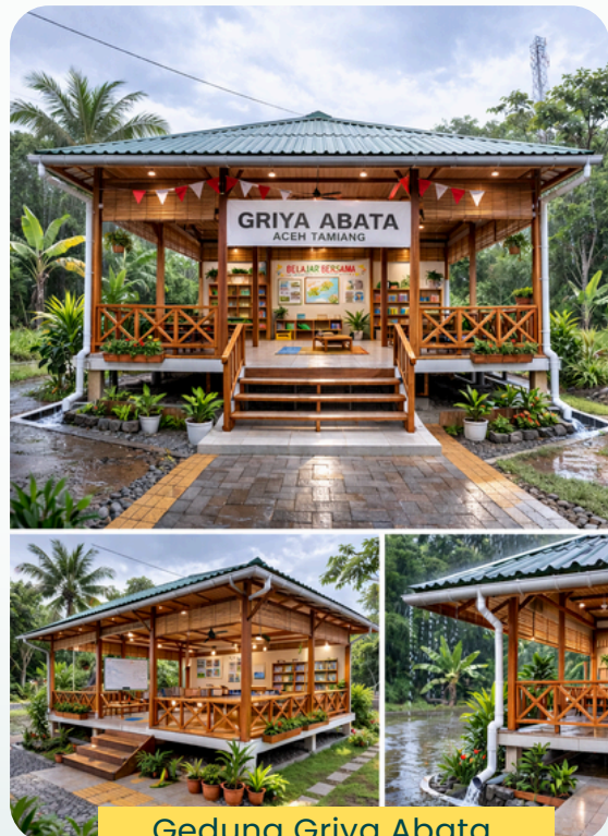
Gedung Griya Abata Aceh Tamiang

Rencana pembangunan Griya Abata Aceh Tamiang dan studio konten fasilitas digital untuk pemberdayaan ekonomi.